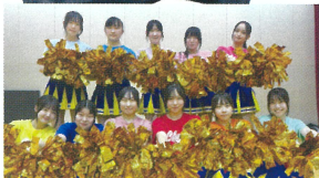
黒石高校チアリーディング部