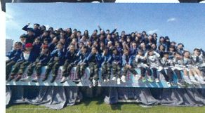
GLITTER DANCE STUDIO