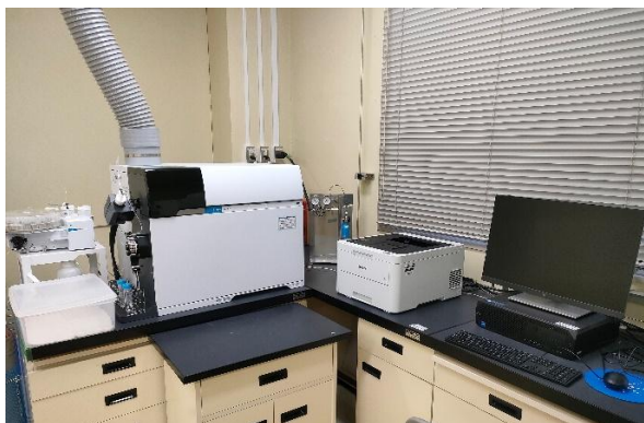
誘導結合プラズマ質量分析装置