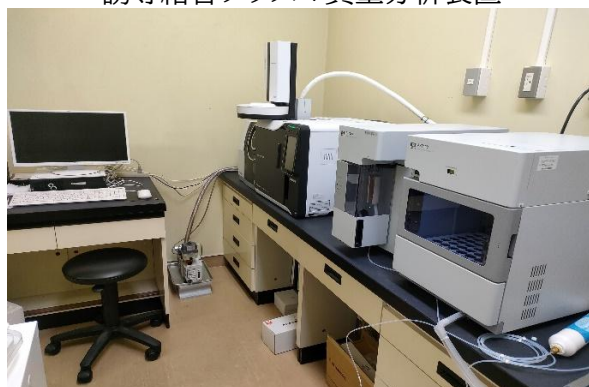
ガスクロマトグラフ質量分析装置