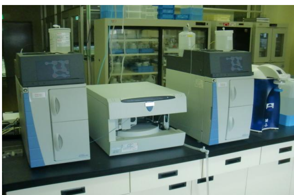
イオンクロマトグラフ