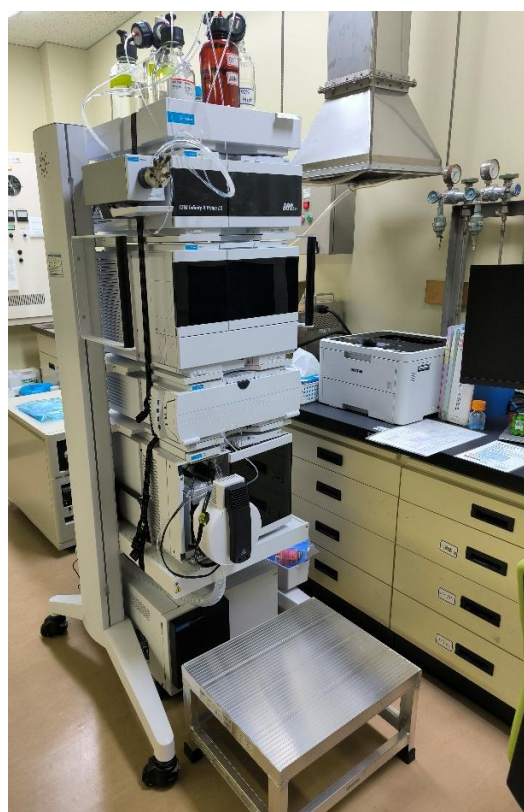
液体クロマトグラフ質量分析計