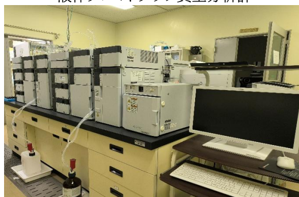
シアン、臭素酸分析装置