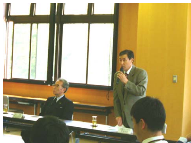
連絡会の様子(津軽広域水道企業団企業団2階会議室)

ポスターは会員の方々へ順次配布していきます。今後の活動については、運営委員会で諮りながら決定していきます。