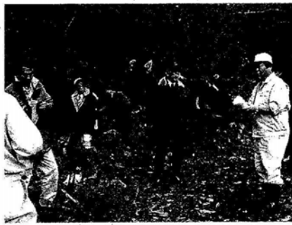
浅瀬石川ダム流域水道水源保全連絡会の水源パトロール

浅瀬石川ダム流域水を巡る。参加者は道水源保全連絡会、水源地の不法投棄現場を視察しながら意見を交わし、今後の管理